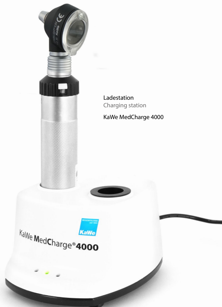
Ladestation Charging station